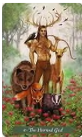
4 РОГАТЫЙ БОГ

Окружённый дикими животными из своих владений, на поляне стоит бог