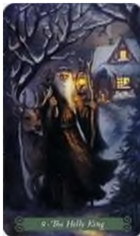
9 КОРОЛЬ ПАДУБ